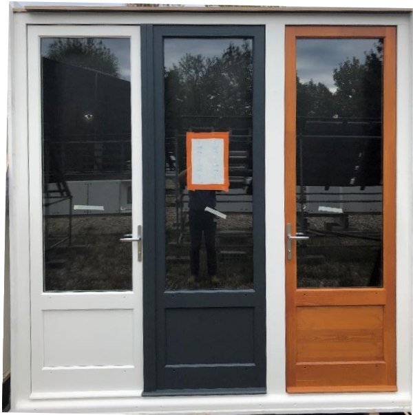
Photographie 1 : Vue d'ensemble de la porte-fenêtre