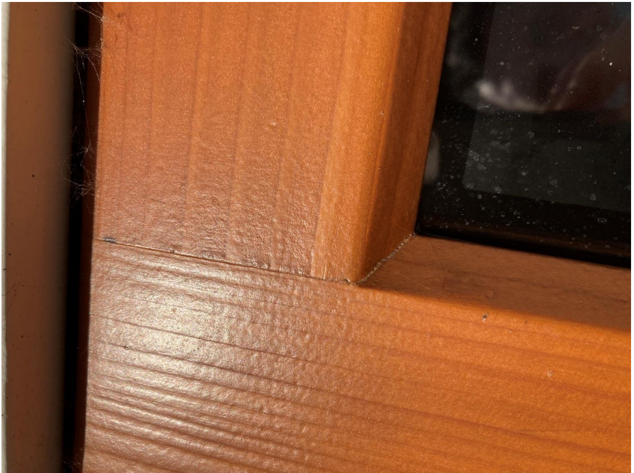
Photographie 6 : Craquelage de l'angle d'assemblage en partie basse du vitrage