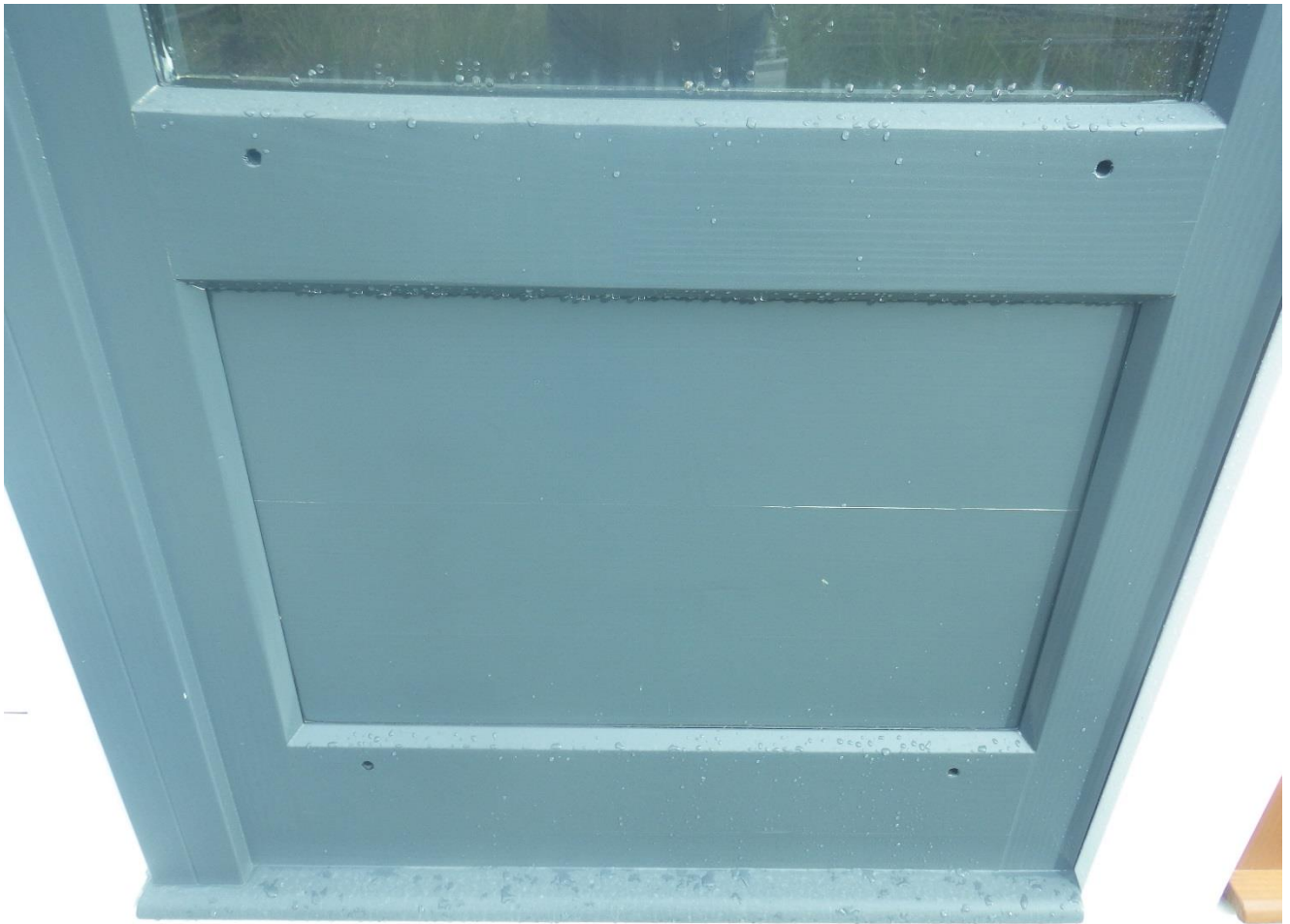
Photographie 2 : Fendillement du panneau de soubassement