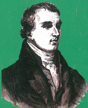
Portrait de David Douglas vers 1828

Naturaliste écossais Explorateur de l'Ouest Américain