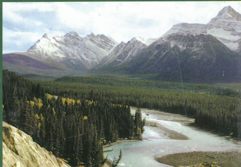
Les Montagnes Rocheuses et l'Athabasca, un cours d'eau utilisé par Douglas en mai 1827

Enfin, découvrez un métier aujourd'hui disparu et la personnalité attachante de ce naturaliste zélé, téméraire et passionné, menant sa carrière au service de la Société d'horticulture de Londres et du botaniste William Hooker comme un véritable sacerdoce. De nos jours, il est considéré comme le plus illustre représentant de cette armée de pionniers : les chasseurs de plantes. David Douglas méritait bien de passer à la postérité grâce au superbe conifère qui porte son nom et ce livre qui lui rend hommage, révèle aux amoureux des plantes et de la nature son oeuvre méconnue, à l'occasion du bicentenaire de sa naissance en 1999.